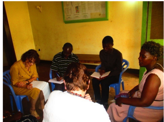
Abb. 4: Die Frauen beim Workshop zum Thema "Rolle der Frau".