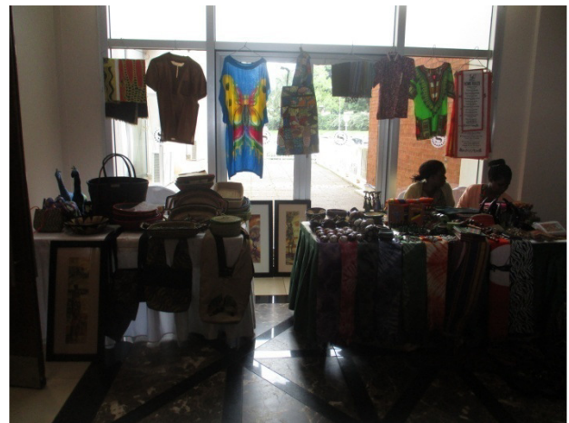
Abb. 6: Ausstellung unserer Produkte bei der Konferenz in Kampala.