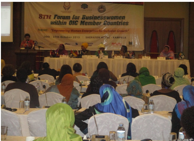
Abb. 5: Forum unserer Partnerorganisation UGAFAT in Kampala.

Im Oktober 2015 wurden wir von unserer Partnerorganisation Ugafat zu einer Ausstellung eingeladen um dort unsere Produkte zu präsentieren, gemeinsam Erfahrungen und Informationen auszutauschen und um neuen Input für die Verbesserung unserer Produkte in punkto Qualität und Art der Produkts zu erlangen.