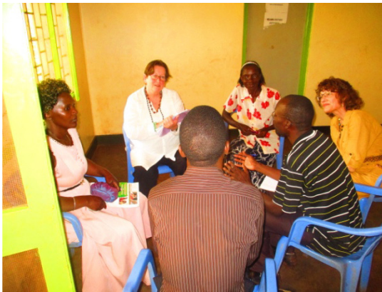
Abb. 3: Die Frauen beim Workshop zum Thema "Rolle der Frau".

Der zweite Workshop beinhaltete Gender Aspekte, vor allem bezüglich der Rolle der Frau in sozio-ökonomischen Aspekten im Hinblick auf Armutsverminderung, sowie auch Entwicklung und Aspekte der Menschenrechte.