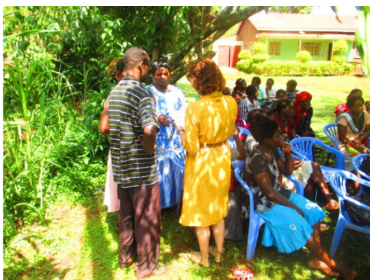
Abb. 1: Die Frauen beim Workshop zum Thema Demokratie.

Von unseren Mitarbeitern vor Ort wurden im Laufe des Jahres verschiedene Extra-Workshops zusätzlich zu den Standard-Trainings angeboten, welche sehr gut ankamen. Der erste behandelte das Thema der demokratischen Teilhabe und Verantwortung, um den Frauen die Rolle von Netzwerken, Organisationen, was eine gute Führungsperson ausmacht und die Wichtigkeit der Kommunikation zwischen Männern und Frauen und deren Teilhabe in Entscheidungsfindungen zu vermitteln.