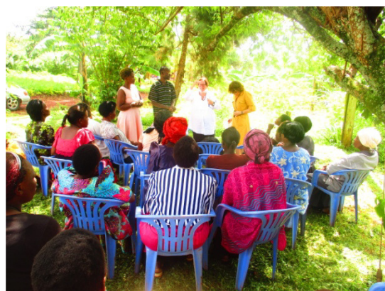
Abb. 2: Die Frauen beim Workshop zum Thema Demokratie.